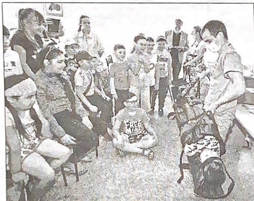
■ Условный пострадавший готов к транспортировке