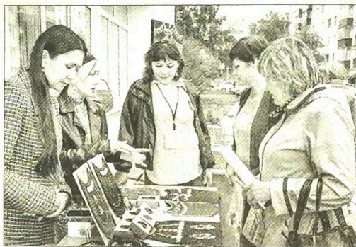
■ На ярмарке мастеров

Качество, работа с войлоком, лепка из глины – эти и многие другие ремёсла помога-