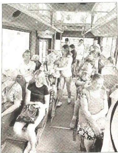
■ Акция «Читающий троллейбус»