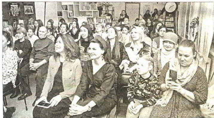
■ В зале нет свободных мест