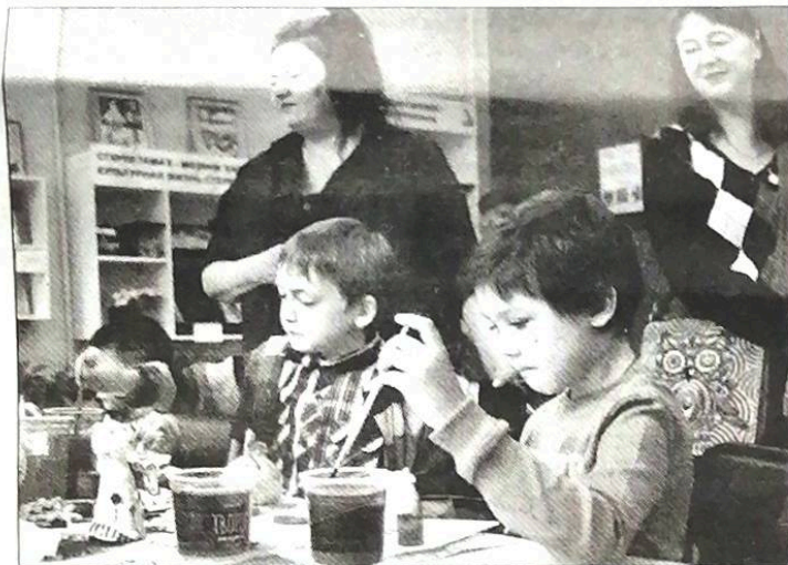
■ Мастер-класс по росписи глиняной игрушки

В творческой мастерской «Горница чудес» – библиотеке-филиале № 3 – силами автономного некоммерческого объединения «Оберег» был организован аукцион творческих поделок молодых людей с ОВЗ, которые были представлены на выставке «Времена года».