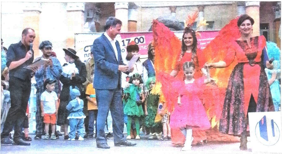
■ Человек доброты и той красоты