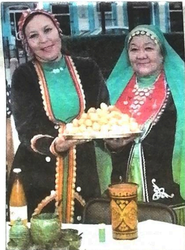
■ Гостеприимство «Арт-Книго-Феста»